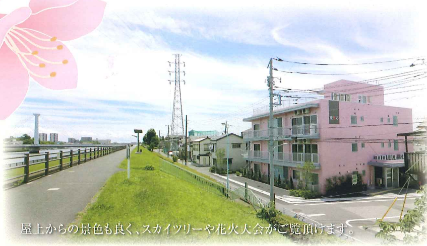
屋上からの景色も良く、スカイツリーや花火大会がご覧頂けます。